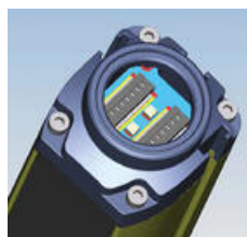
A némitólámpa fedele alatti DIP-kapcsolókkal végezhető a konfigurálás.

Mivel a konfigurálás DIP-kapcsolókkal és elektromos csatlakozással végezhető, nincs szükség szoftverre.